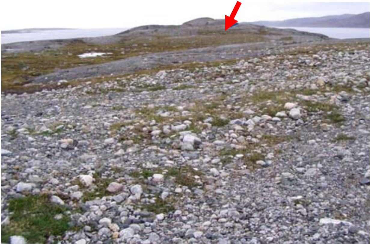
Fig. 3 Futur terrain pour l'emplacement de la centrale d'Hydro-Québec, en arrière plan, le site JeGn-34 (flèche rouge)