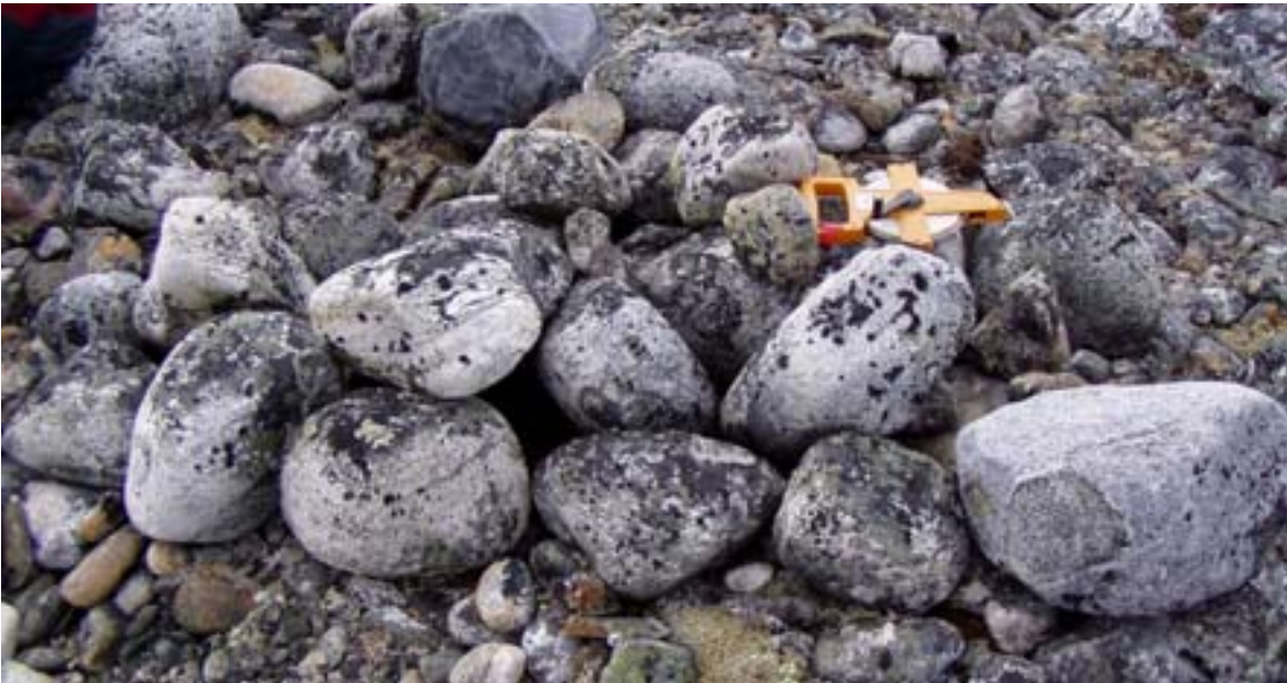
Fig. 7 Piège à renards sur le site JeGn-34, vue ouest