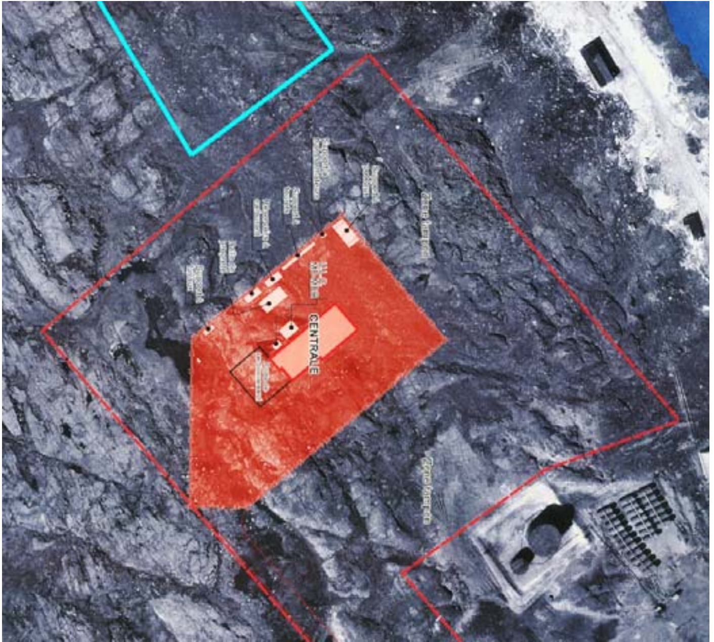
Fig. 10 Zone sensible du point de vue archéologique en bleu sur la photo (carte modifiée)