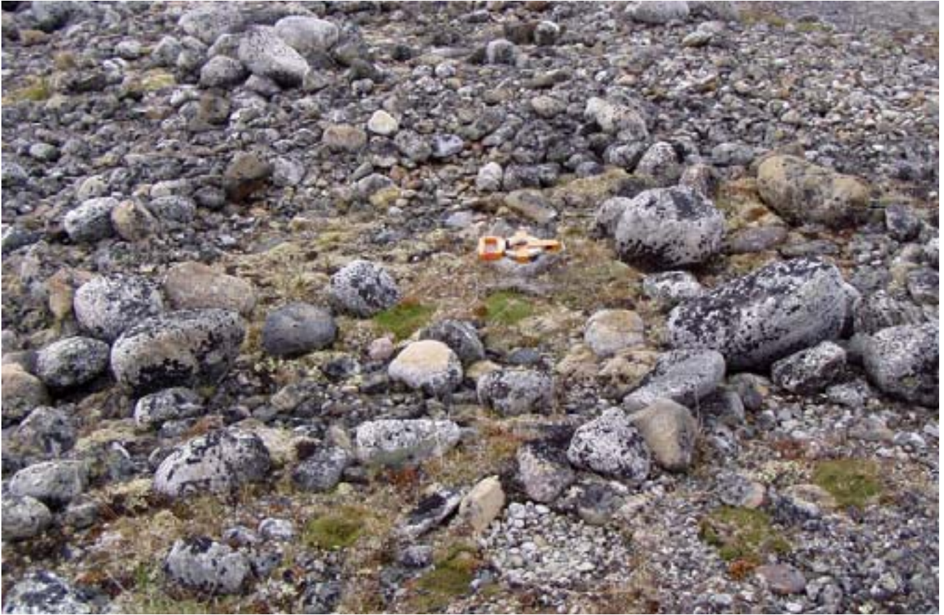
Fig. 9 Structure d'habitation sur le site JeGn-34