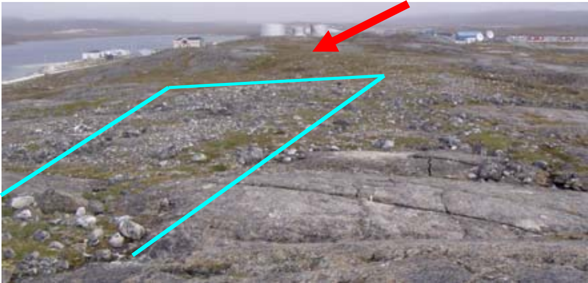
Fig. 6 Champ de blocs où se localise le site JeGn-34 (limites du site en bleu), en arrière plan (flèche rouge) le futur emplacement de la centrale d'Hydro-Québec (vue est)