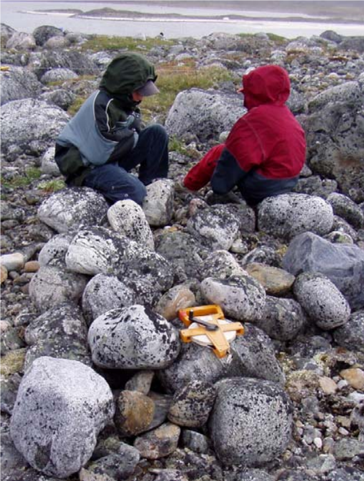
Fig. 8 Piège à renards sur le site JeGn-34, vue sud