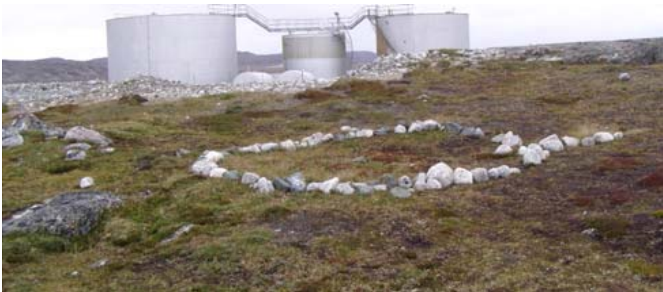
Fig. 4 Site non répertorié sur le futur terrain de la centrale d'Hydro-Québec