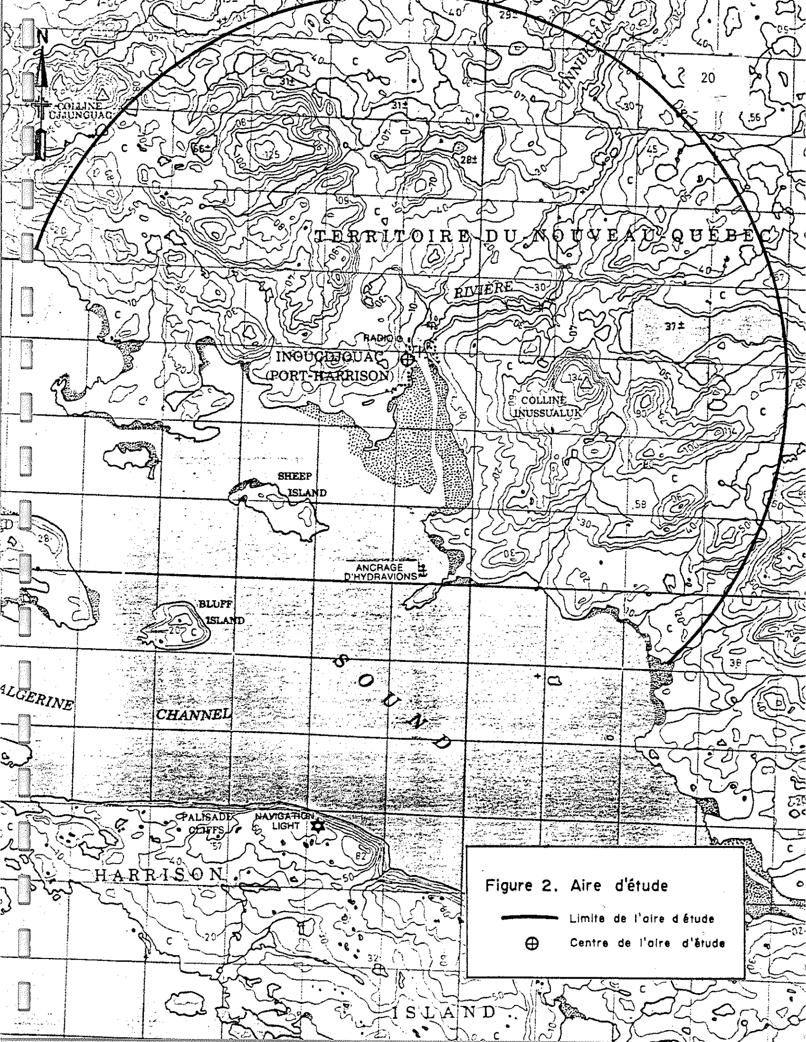
Figure 2. Aire d'étude